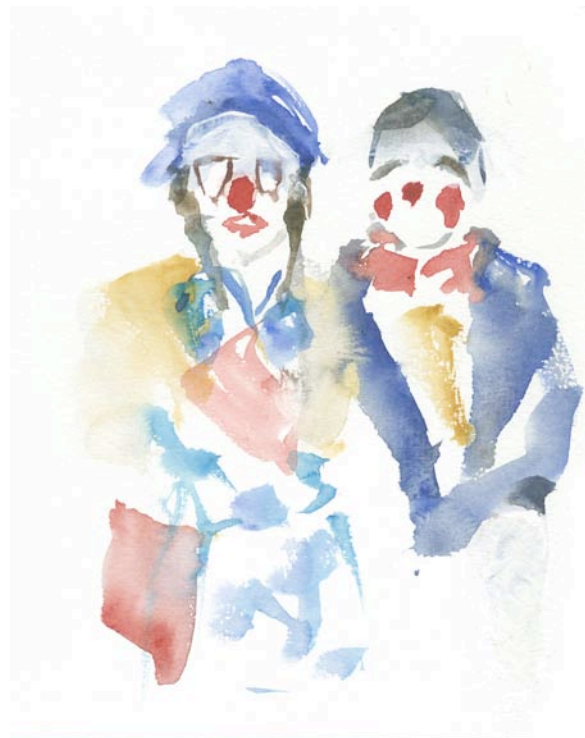
Aquarelles réalisées au CHV de Valence par Myriam DU MANOIR – Artiste drômoise.

Mais soudain, un sourire, un rire, une blague, un instant. Vous.